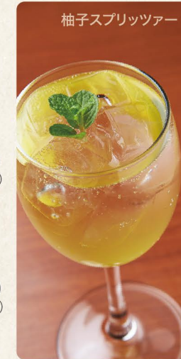
柚子スプリッツァー