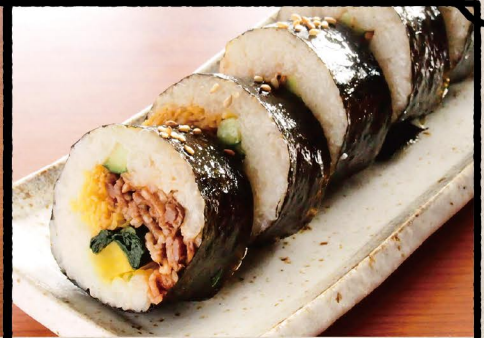
キンパ 780 Korean Rolled SUSHI (税込 858)