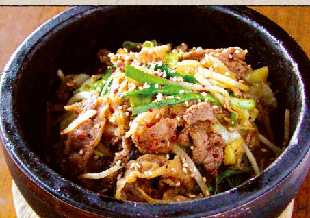
プルコギ石焼ご飯 1100 スープ付き (税込 1210) Baked Rice with Vegetable & Beef BBQ