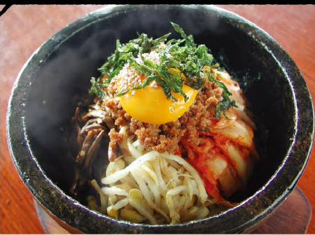
石焼ビビンバ 1100 スープ付き (税込 1210) "Bibimbap", Baked Rice