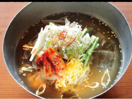
韓国冷麺 1050 Korean Cold Noodles (税込 1155)