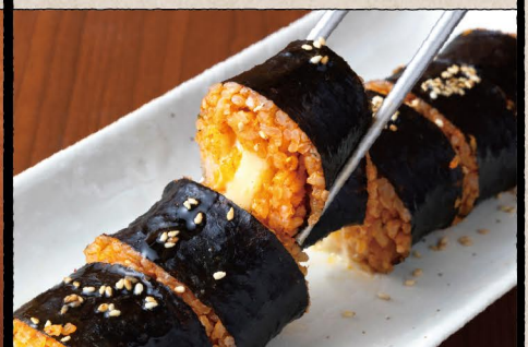
チーズキンパ 🌶️ 880 Korean Rolled SUSHI with Cheese (税込 968)