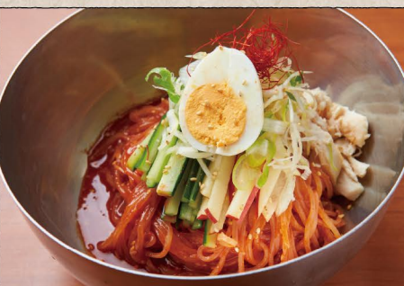
ビビン麺 🌶️🌶️🌶️ 1150 Chilled Spicy Soup Noodle (税込 1265)