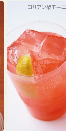
コリアン梨モーニ