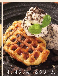
オレオクッキー&クリーム