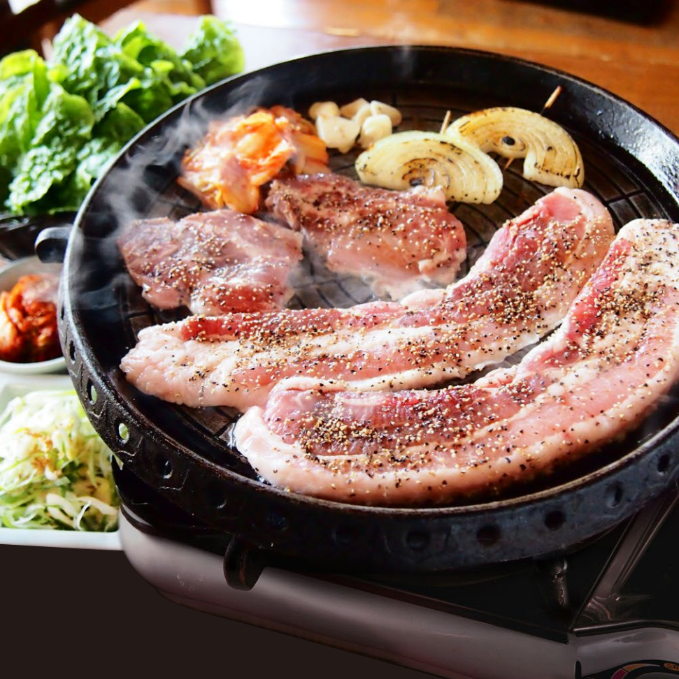
"Samgyeop-sal", Grilled Pork Belly BBQ