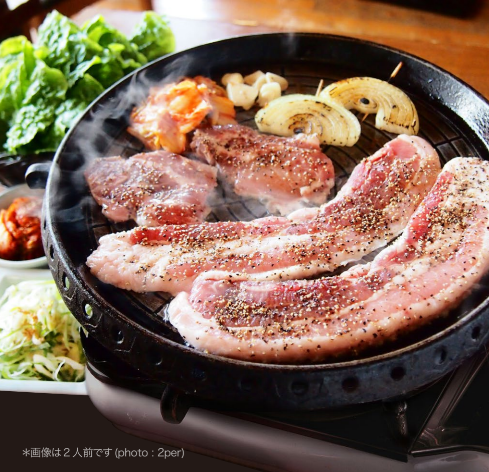
*画像は2人前です (photo : 2per)