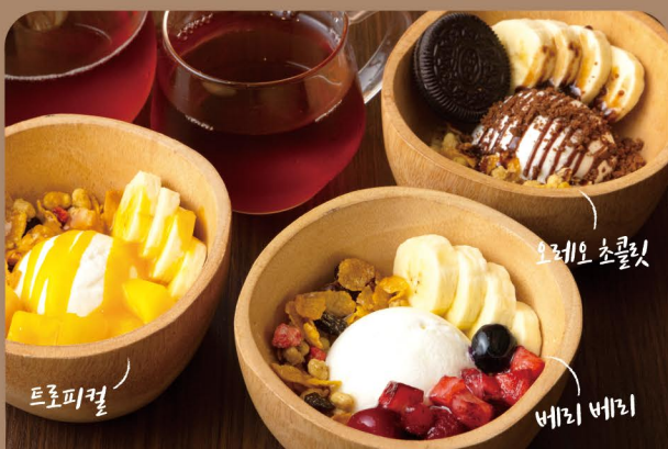
グreekヨーグルト Greek Yogurt 水分を切ったなめらかなクリーミー食感。濃厚な味わい