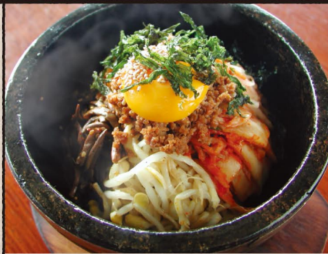
石焼ビビンバ "Bibimbap", Baked Rice