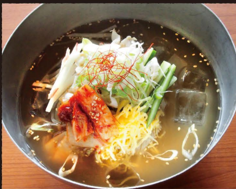
韓国冷麺 Korean Cold Noodles