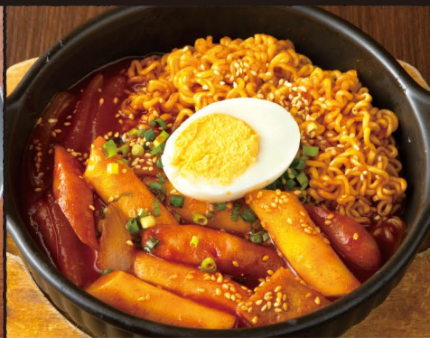
ラッポギ 🔥 Noodles with Fried Spicy Rice Cake