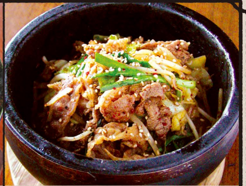
プルコギ石焼ご飯 Baked Rice with Vegetable & Beef BBQ