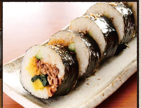
キンパ Korean Rolled SUSHI